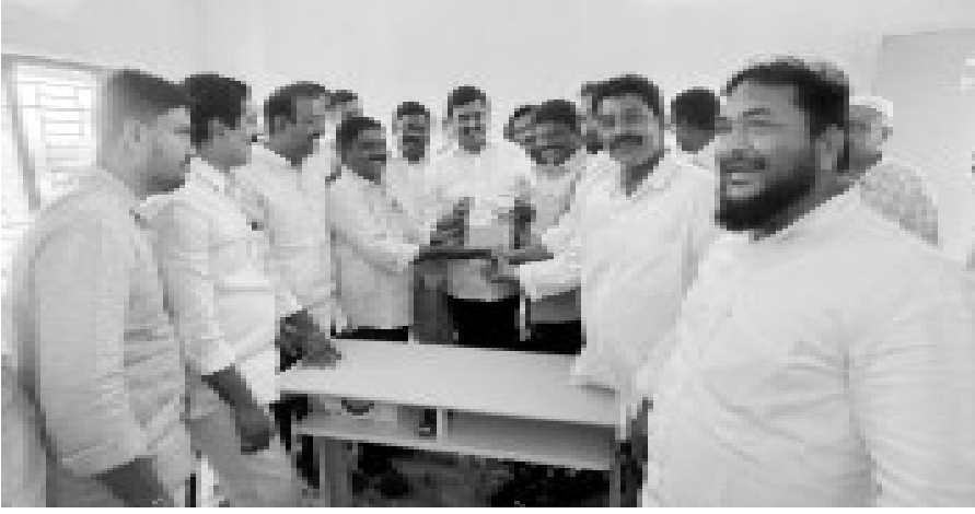
అనంతపురం జిల్లా కలెక్టర్కు ఫెడరేషన్ ప్రచురించిన మీడియా డైరీని అందజేస్తున్న జిల్లా నాయకులు