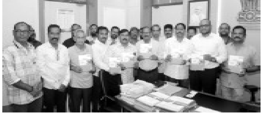
అనంతపురం జిల్లా కలెక్టర్కు ఫెడరేషన్ ప్రచురించిన మీడియా డైరీని అందజేస్తున్న జిల్లా నాయకులు