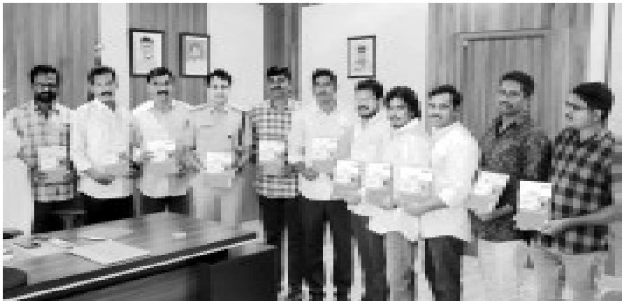
కాకినాడలో ఫెడరేషన్ జిల్లా శాఖ ఆధ్వర్యంలో నిర్వహించిన మీడియా డైరీ ఆవిష్కరణ కార్యక్రమం