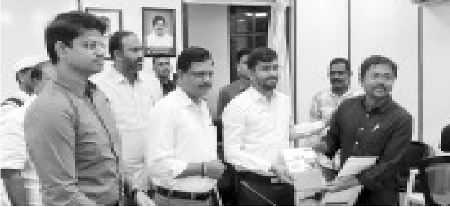
కాకినాడ జిల్లా కలెక్టర్కు ఫెడరేషన్ ప్రచురించిన మీడియా డైరీని అందజేస్తున్న జిల్లా నాయకులు